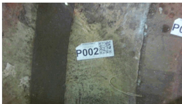
002EW504803 n°2 - 2 (P2) - RDC - UTD - Vol 1 (Pièce)