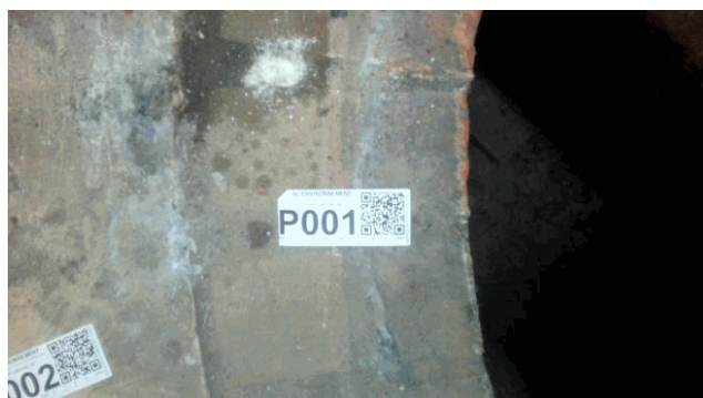
002EW504803 n°1 - 2 (P1) - RDC - UTD - Vol 1 (Pièce)